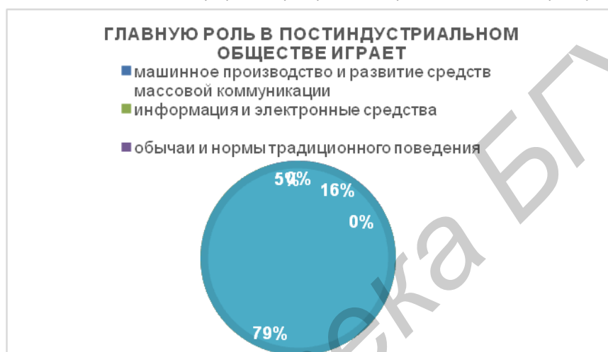
График № 2 - распределение ответов на вопрос "Что играет главную роль в постиндустриальном обществе?"

Таким образом, постиндустриальное общество – это новый этап развития человечества, в экономике которого преобладает инновационный сектор с высокопроизводительной промышленностью, индустрией знаний, с высокой долей в ВВП высококачественных и инновационных услуг, с конкуренцией во всех видах экономической и иной деятельности.