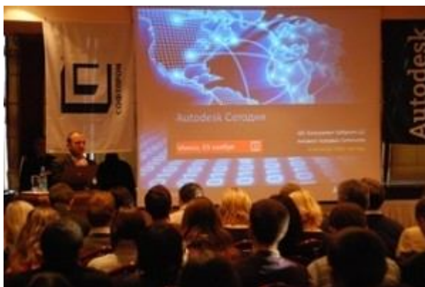
Рис.3 - Конференция "Autodesk Day в Беларуси"

В заключение можно сказать, что AutoCAD, несмотря на его отдельные недостатки, настолько функционален, что полной замены его возможностей на данный момент не имеет ни одна конкурентоспособная программа. AutoCAD даёт возможности, позволяющие инженерам, архитекторам и конструкторам испытывать свои идеи еще до их реализации.