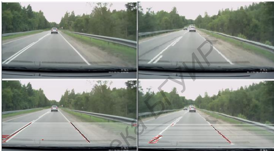
Рисунок 1 – Работа системы в хороших погодных условиях

В при хорошей освещенности в светлое время суток из на 100 кадрах было распознано 95% разметки и 95% имели правильное направление распознанной разметки. Работа алгоритма иллюстрируется на рисунке 1.