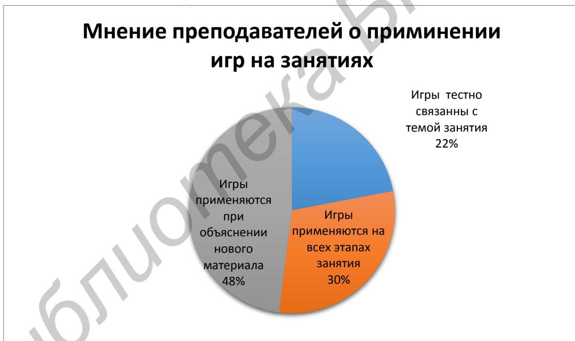
Диаграмма 1. Мнение преподавателей о применении игр на занятиях

* социализации: включение в систему общественных отношений, усвоение норм человеческого общежития.